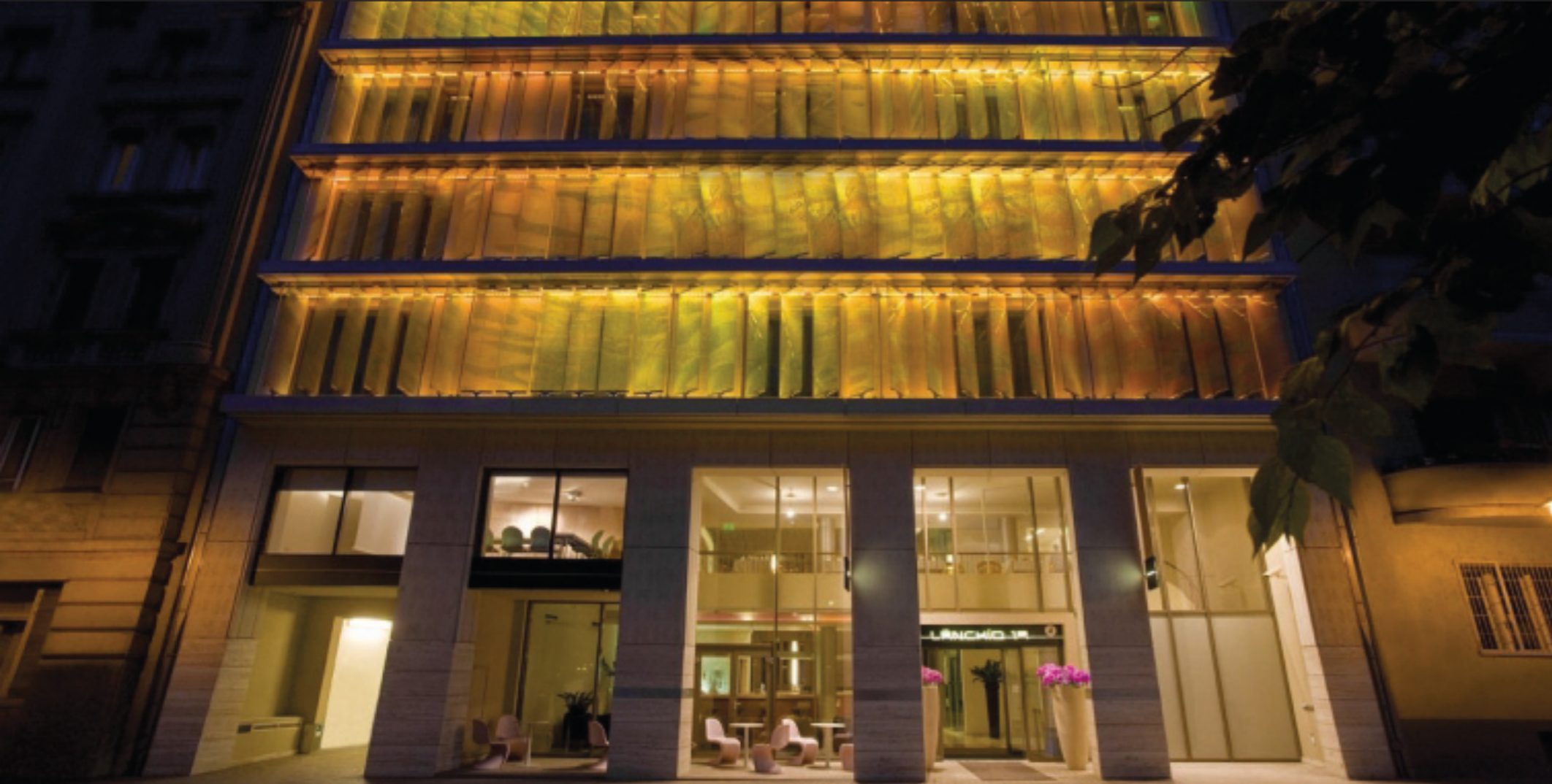
Lánchíd 19 Hotel★★★★ Budapest

A szállodai rendszer front office, vendéglátás és áruforgalom szoftvereket foglal magában.